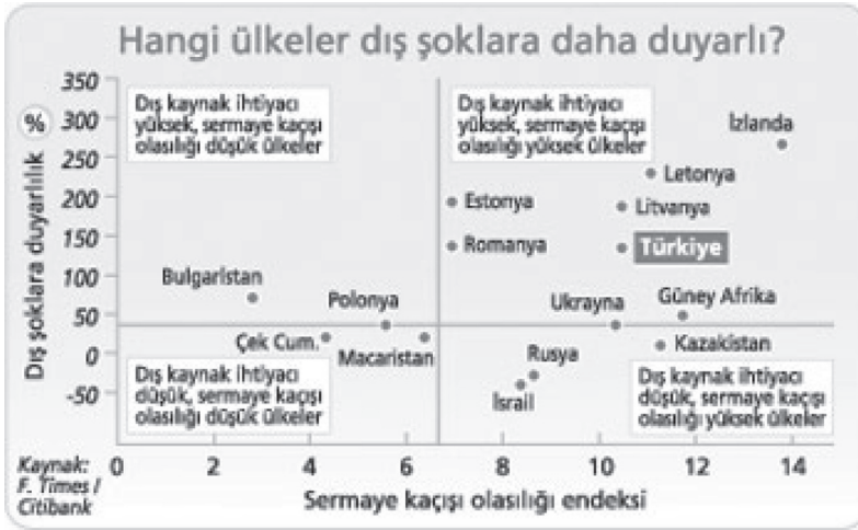
Şekil-1: Ülkelerin dış şoklara duyarlılığı

Türkiye ekonomisi bir yanda dış kaynağa bağımlılık öte yanda çekilen kaynağın geri kaçma olasılığı (sermaye kaçıışı) kriterleri dikkate alınarak hazırlanan aşağıdaki şekilde de görüldüğü gibi dış şoklara en açık ülkelerin başında geliyor 2 .