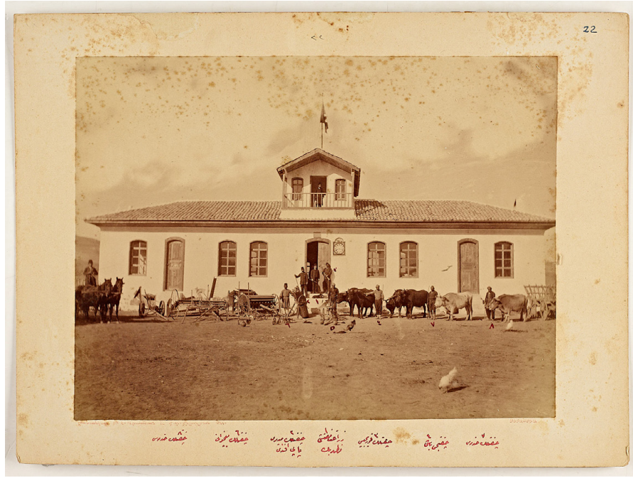
Ziraat müfettişi; Çiftlik hademesi; Çiftçiabaşı; Çiftlik bahçıvanı; Çiftlik korucusu.