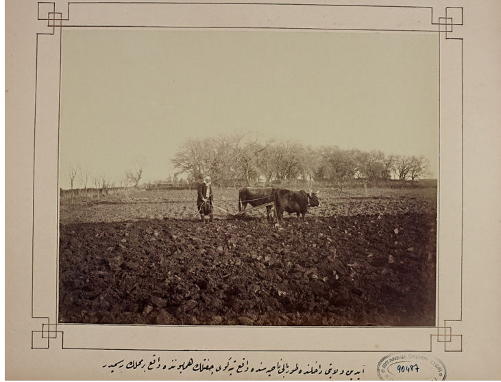
Torbalı'da Tepeköy Çiftlik-i Hümayûnu

juva-bürokratların rekabetinden azade kalmış olabilirler, dolayısıyla da her iki grup arasındaki çatışmaların yansıması olan çiftlikat nizamnameleri gündeme gelmemiş diyebiliriz. Burada çiftlikat-ı hümayunu besleyen önemli kaynağın müsadere edilen ayan çiftlikleri olduğunu hatırlayalım. Balkanlar'daki Tepedelenli Ali Paşa çiftlikleri girişimci paşalar ve yerel toprak sahipleri arasında paylaşılırken, Batı Anadolu'daki Karaosmanoğlu çiftlikleri genelde aile tasarrufunda kalmaya devam etmiş, en kötü ihtimal satılarak elden çıkarılmıştır.