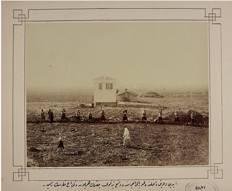
İstanbul Üniversitesi Kütüphanesi Nadir Eserler Bölümü, Fotoğraf: 90487—0039. Torbalı’da Tepeköy Çiftlik-i Hümayûnu (Carlo Bükmeciyân)

de vurgulanmaktadır. Ama kırsal alandaki toplumsal farklılaşmanın, piyasalardaki gelişmeler ve mali sistemdeki dönüşümün etkisi altında ortaya çıkardığı ayan/eşraf kesiminin de tasarruf etmeye başladıkları çiftlikler üzerinden kırsal alandaki kapitalistleşmede rol oynadığını söylemek gerekir. Makale boyunca göstereceğimiz üzere, Osmanlı coğrafyasına özgü kapitalistleşme maliye sistemi dolayısıyla finans sektörüne bağımlı bir gelişmeyi gündeme getirmiştir; bu bağlamda pre-kapitalist tarımdan kapitalist tarıma geçiş çiftlik sahiplerinin tarımsal üretimin organizasyonu dışında finans ve ticaret alanlarındaki hâkimiyetlerinin derecesine bağlı olmuştur.