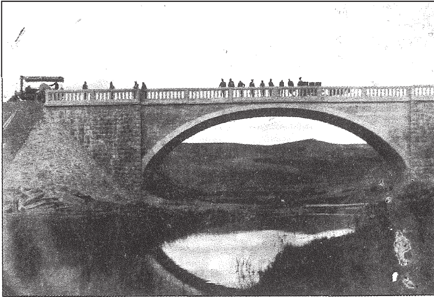
Sazak, Emin Bey... , s. 252.

Demiryolu yapımına giren ilk Türk firmalarından Cumhuriyet İnşaat Türk Anonim Şirketi’nin Ankara Sivas Demiryolu hattında yaptığı ilk köprülerden biri.