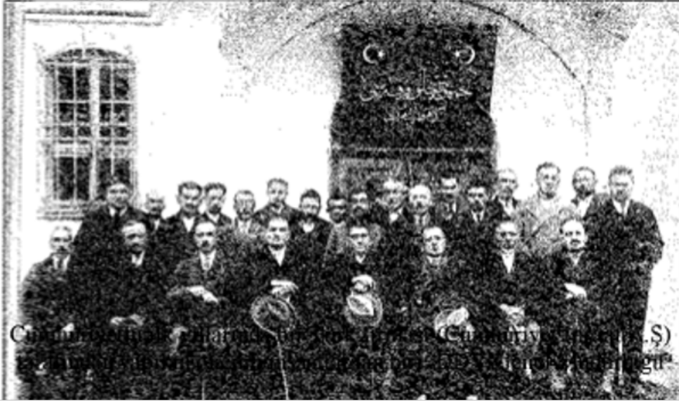
Sazak, Emin Bey... , s. 252.

Demiryolu yapımına giren ilk Türk firmalarından Cumhuriyet İnşaat Türk Anonim Şirketi’nin Ankara Sivas Demiryolu hattında yaptığı ilk köprülerden biri.